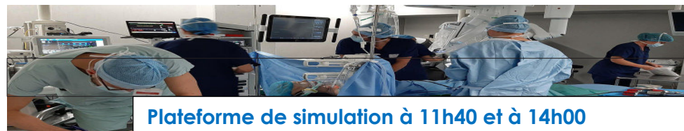
Plateforme de simulation à 11h40 et à 14h00